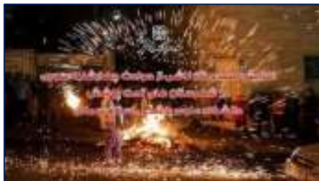
افزایش مصدومان ناشی از حوادث چهارشنبه سوری در شهرستان های تحت پوشش دانشگاه ۱۴۰۳/۱۲/۱۳