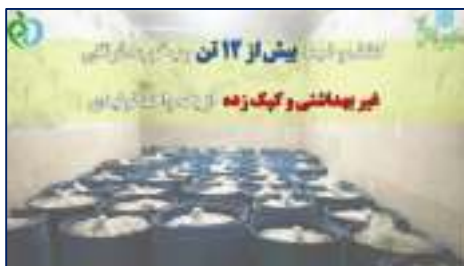
در نتیجه نظارت مستمر بر واحد های تولید مواد غذایی: کشف و ضبط بیش از ۱۲ تن رب گوجه فرنگی غیربهداشتی و کپک زده در شهر ایوانکی توسط دانشگاه علوم پزشکی استان سمنان ۱۴۰۳/۱۲/۱۴