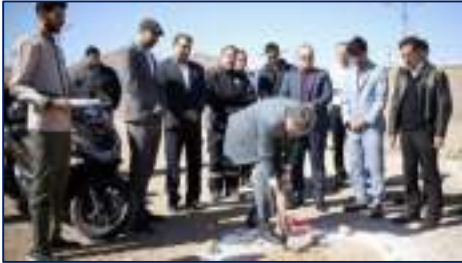
آئین آغاز ساخت و احداث پروژه های عمرانی دانشگاه علوم پزشکی استان سمنان برگزار شد ۱۴۰۳/۱۲/۰۵