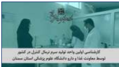
کارشناسی اولین واحد تولید سرم نرمال کنترل در کشور؛ گامی مثبت در راستای خودکفایی دارویی ۱۴۰۳/۱۲/۱۳