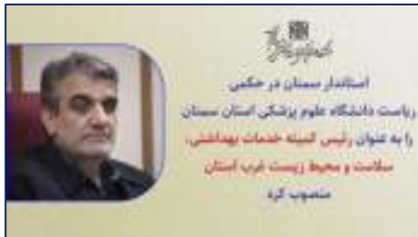
انتصاب دکتر قدس رئیس دانشگاه به عنوان رئیس کمیته خدمات بهداشتی، سلامت و محیط زیست غرب استان ۱۴۰۳/۱۲/۱۴