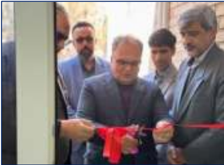
آزمایشگاه بیماری های ریوی مرکز بهداشت استان سمنان به بهره برداری رسید ۱۴۰۳/۱۲/۰۵